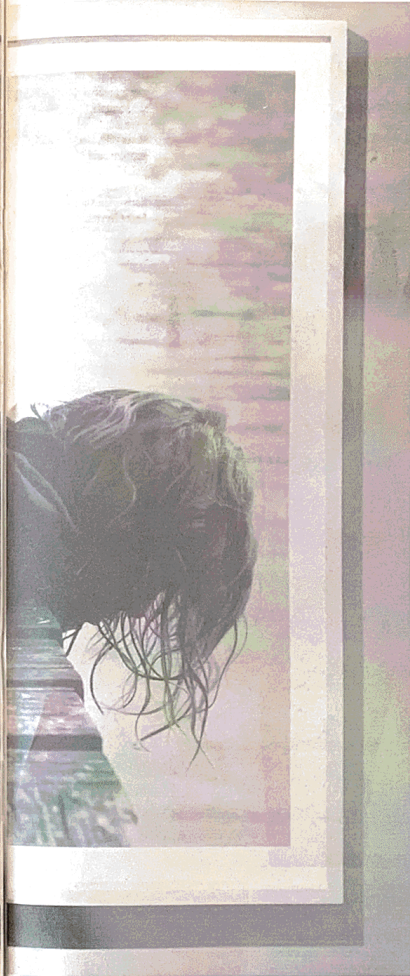
– DRØMMEKJØP: Foto av Tom Sandberg, Utitled 2000/2001. Dette er fotografert i galleriet til Helene Gulaker Hansen før det ble solgt. Bildet skulle hun gjerne eid i dag. FOTO: TOM SANDBERG

– Jeg er jurist og kunsthistoriker, derfor gir det meg mening å ha det på veggen. I tillegg anses det som et av hennes hovedarbeider. Fotografiet er kjøpt inn av blant annet TATE. Kanskje Blomqvist skulle ha tilbudt